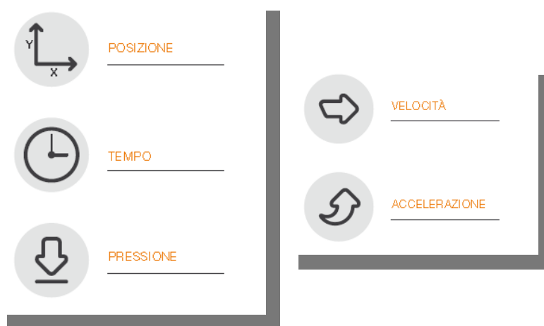
Fig.1 - Schema

E' possibile elaborare velocità e accelerazione ai fini di analisi forensi.